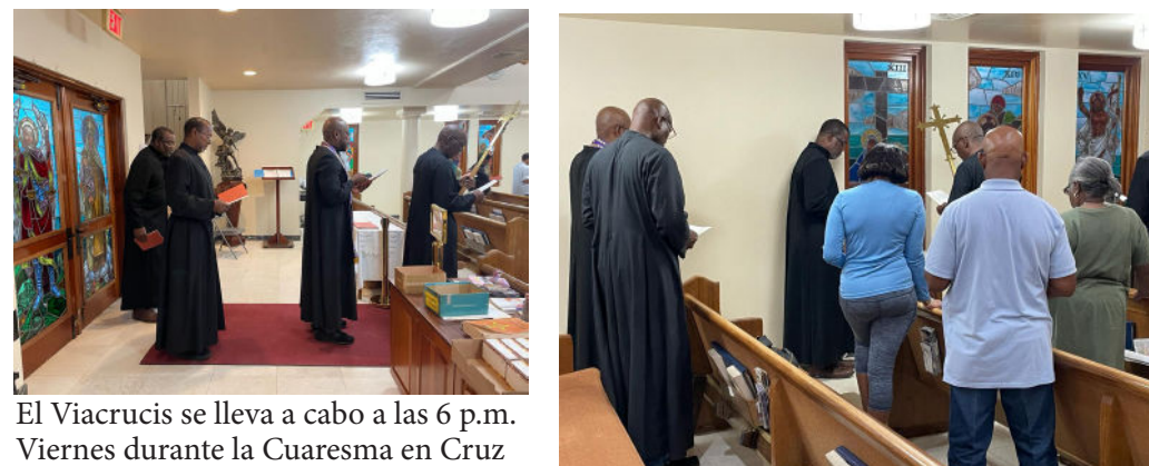
El Viacrucis se lleva a cabo a las 6 p.m. Viernes durante la Cuaresma en Cruz Bay y Coral Bay.