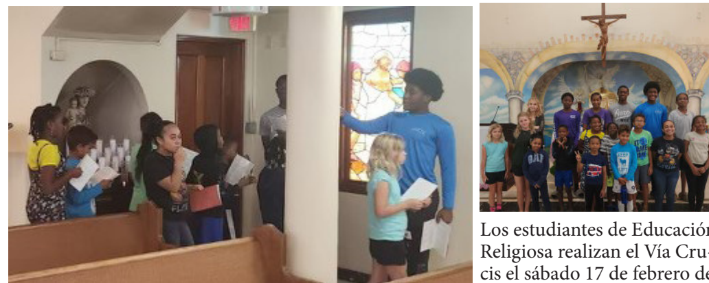
Los estudiantes de Educación Religiosa realizan el Vía Crucis el sábado 17 de febrero de 2024.